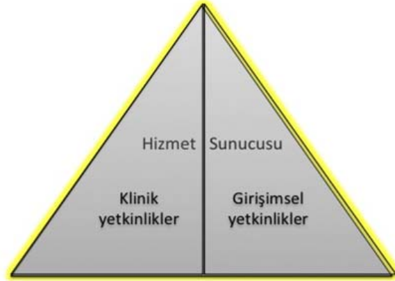
Şekil 2- TUKMOS yedinci temel yetkinlik alanı: Hizmet Sunucusu

Girişimsel Yetkinlik: Bilgiyi, kişisel, sosyal ve/veya metodolojik becerileri tıbbi girişimler konusunda kullanabilme yeteneğidir.